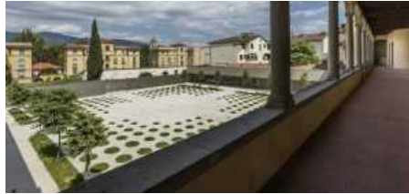
Il giardino di Palazzo Fabroni

culturale dell'Ambasciata Italiana in Ecuador. Lo scopo era di presentare il caso di Palazzo Fabroni come esempio delle connessioni tra arte contemporanea, natura/paesaggio, scienza e sostenibilità ambientale.