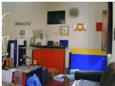
Una sala della casa-studio Melani

Sabato 29 maggio riapre anche la Casa-studio Fernando Melani con visita accompagnata su prenotazione da effettuare entro le ore 13 del 28 maggio