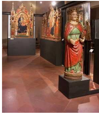
Il museo civico di Pistoia