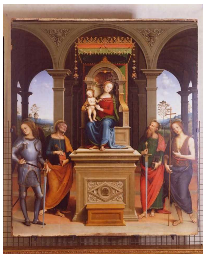
Dipinto di Gerino Gerini

L'allestimento del museo pistoiese risale al 1982. Al ricercatore della Scuola Normale Superiore di Pisa Giacomo Guazzini, autore della scoperta a Padova di due cicli di affreschi di Giotto, il compito di aggiornare il patrimonio e di elaborare nuovi contenuti in vista della revisione delle collezioni