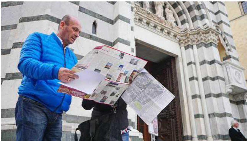
Turisti a Pistoia per le festività pasquali

Pistoia, 16 aprile 2019 - Pasqua e Pasquetta? In città, a passeggiare per il centro e far sosta a uno dei tanti musei che in questi due giorni resteranno aperti . Porte aperte infatti al Museo Civico di arte antica, al Museo dello Spedale del Ceppo, al Battistero di San Giovanni in Corte, alla cattedrale di San Zeno, alle chiese di Sant'Andrea e San Giovanni Fuorcivitas e al Museo dell'Antico Palazzo dei Vescovi resteranno aperti. Si potranno visitare anche le Sale Affrescate che ospitano la mostra Conflitti e Armonie (ingresso gratuito dalle 10 alle 13 e dalle 15 alle 19). In programma iniziative dedicate a famiglie e bambini e numerosi concerti di musica in centro storico per festeggiare il quarantesimo compleanno del Pistoia Blues Festival .