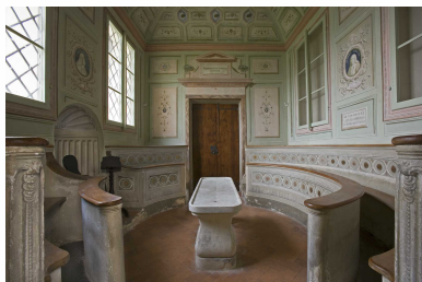
In questa e nell'immagine della homepage il museo dello Spedale del Ceppo

Per ulteriori informazioni è possibile contattare i Musei e Beni Culturali del Comune di Pistoia allo 0573 371214, 371277, 371296. Tutte le informazioni e i programmi completi delle attività didattiche sono scaricabili dall'indirizzo http://musei.comune.pistoia.it/le-proposte-