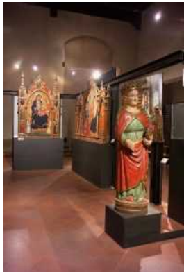
Il museo civico di Pistoia

Domenica 19 maggio, alle 16 al Museo dello Spedale del Ceppo un laboratorio per famiglie dal titolo "Arte e scienza/Scienza e arte". Prenotazioni da effettuare entro le ore 13 di oggi venerdì 17 maggio a Pistoiainforma